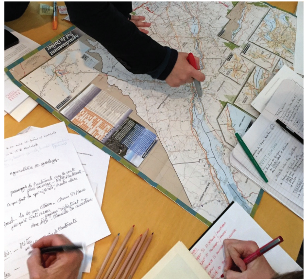
Workshop à la MAQ