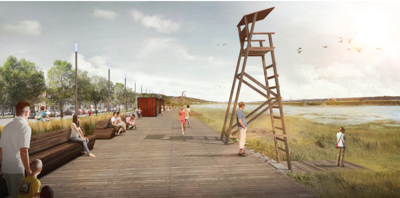
Mise en valeur du littoral Est et de ses abords, Québec