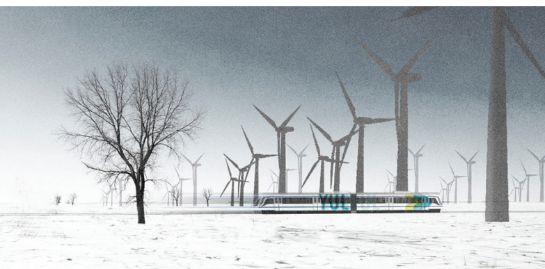
YUL : MTL Paysages en mouvement