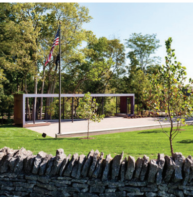
Grounds of Remembrance