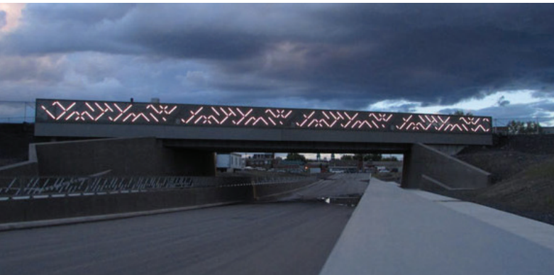
Pont ferroviaire, campus Outremont