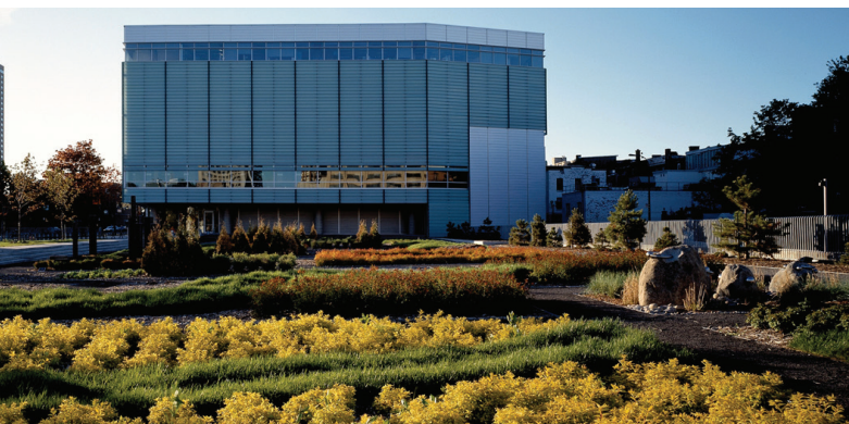
Jardin de la Grande bibliothèque du Québec