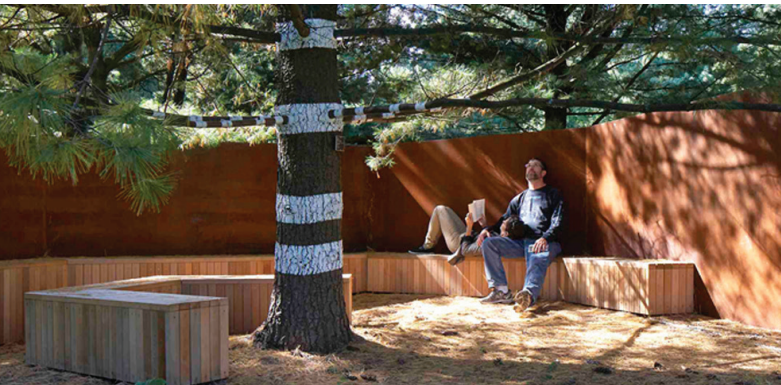
Arboretum