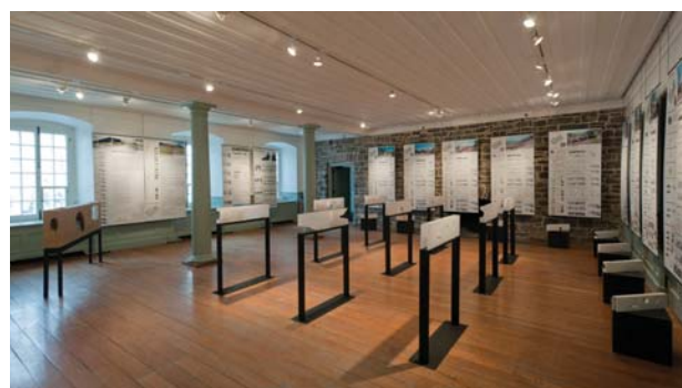
L'exposition à l'Université Laval

mercredi - vendredi de 13h à 18h samedi - dimanche de 12h à 17h 181, rue St-Antoine Ouest Métro Place d'Armes